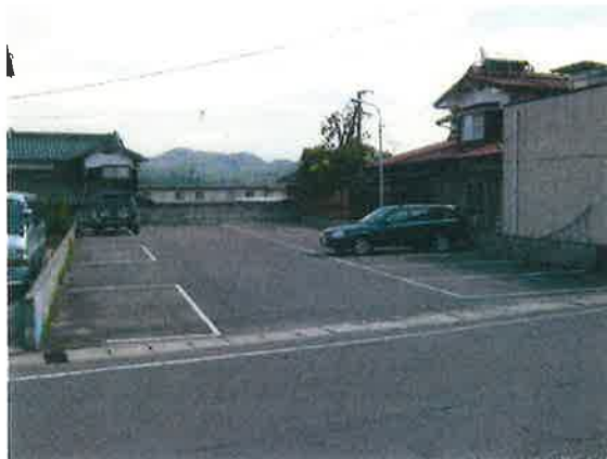
宮野 小学校 校目の前